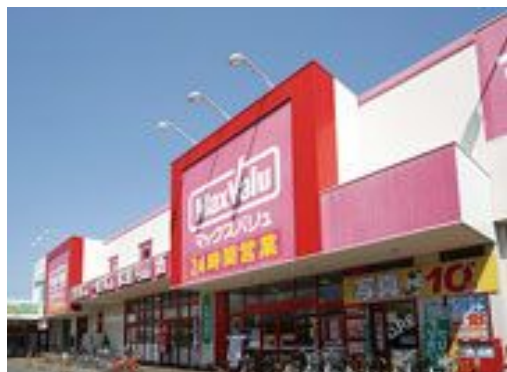
マックスバリュ新琴似